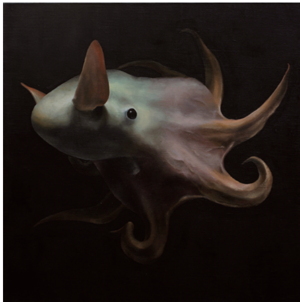
「じゅーもんじだこ」 2008 72.7×72.7cm 油彩 キャンバス "Dumbo octopus ( Stauroteuthis syrtensis )" oil on canvas